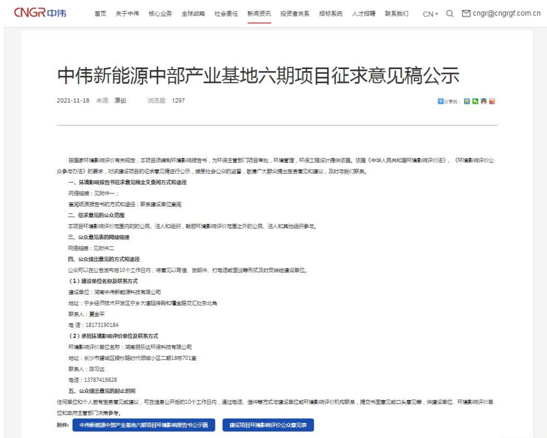
图 3.2-1 征求意见稿网络公示截图