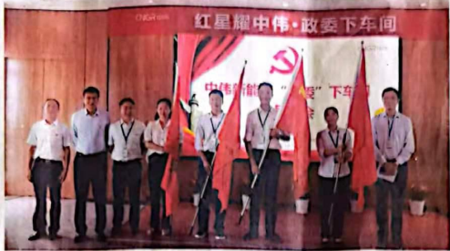
中共邵阳市委“党建聚力 赋能高质量发展”主题党日活动

伟大的时代呼唤伟大的思想，伟大的实践呼唤伟大的理论。进入新时代，宁乡经开区以习近平新时代中国特色社会主义思想为指导，深入贯彻落实党的二十大精神，坚持以高质量党建引领高质量发展，推动党建工作与经济社会发展深度融合，为宁乡经开区高质量发展提供了坚强的政治保证和组织保证。